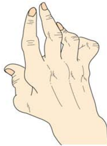
関節リウマチによる手指の変形